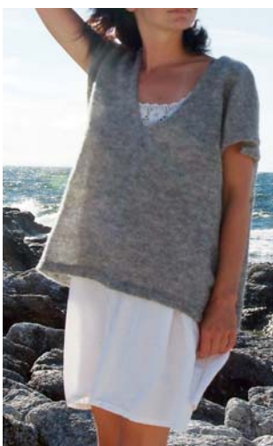
V-ringat med holk ärm. Här i entrådigt gotlandsgarn. Garnkostnad M/L 280:- i naturgrå nyanser. Samma modell i bomullsgarn från 192:-.